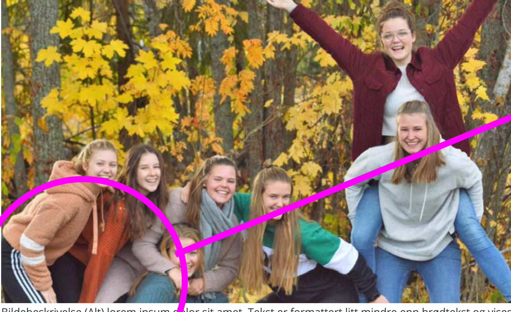
Bildebeskrivelse (Alt) lorem ipsum dolor sit amet. Tekst er formattert litt mindre enn brødttekst og vises rett under bildet.

Når Description legges inn på bilde via RTE vises dette nedenfor bildet som her.